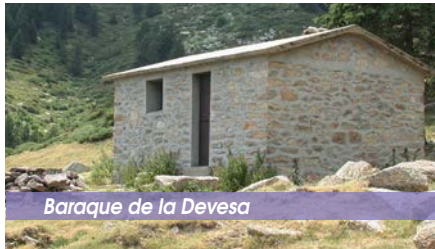
Baraque de la Devesa

Le long du parcours vous pourrez découvrir plusieurs vestiges de plateformes charbonnières en forêt. Celles-ci sont reconnaissables par la présence de petits bouts de charbon. Ces derniers étaient un élément indispensable pour faire fondre le minerai de fer extrait du massif du Canigó.