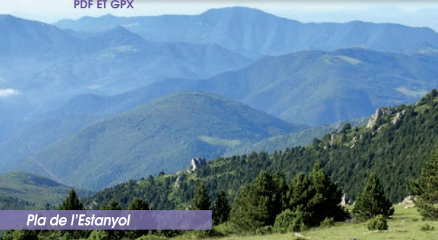
Pla de l'Estanyol