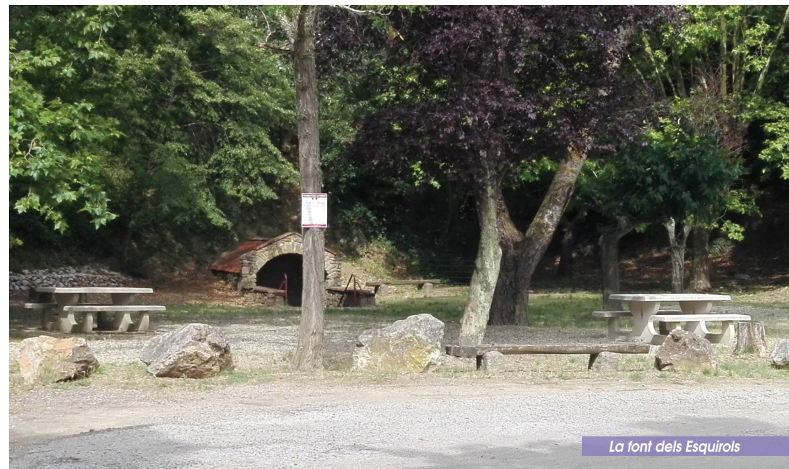
La font dels Esquiroles