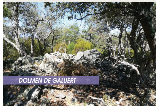
DOLMEN DE GALUERT