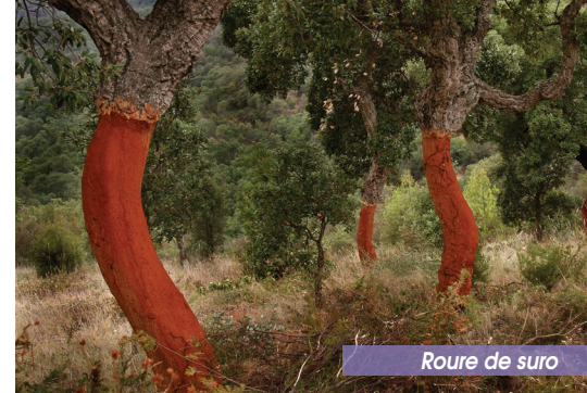
Roure de suro

La font dels esquiroles, aquest lloc privat us espera a l'ombra de diverses espècies d'arbres.