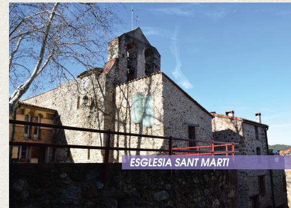
ESGLÉSIA SANT MARTI

Aquesta església s'esmenta per primera vegada el 1011, és una església romànica d'una sola nau. El monument ha sofert moltes transformacions durant la seva història. Un coronament emmerletat supera els murs sud i nord. Al segle XVIII, la nau es va alçar amb una corona de parapets a la banda nord i es va construir una capella al costat nord. L'edifici té un campanar de dues finestres de badia que conté dues campanes i conserva un retaule de Crist del segle XII, XVII i XVIII i dues campanes al campanar.