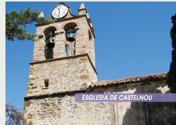
ESGLÉSIA DE CASTELNOU

La seva construcció desitjada per Guillem V, vescomte de Castellnou, fou construïda al segle XIII pels plobetans de Castellnou. És d'estil romànic gòtic. A veure absolutament: Remarcable escultura de St Roch - Pintura contemporània «d'un Crist en Majestat» de Camille Descossy classificada el gener de 2019 - Porta d'entrada del segle XIII, classificada el 1971.