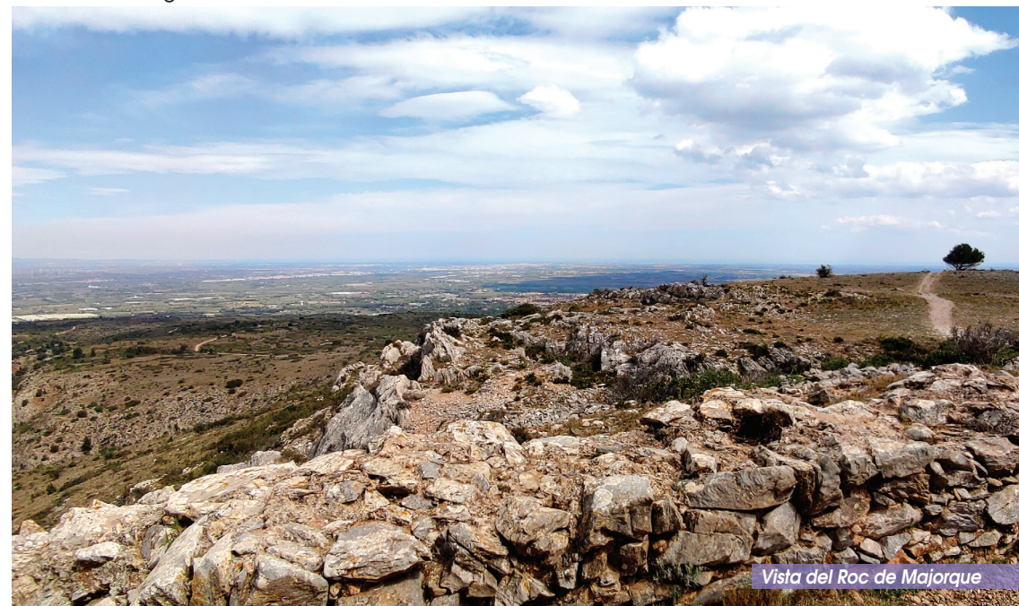
Vista del Roc de Majorque