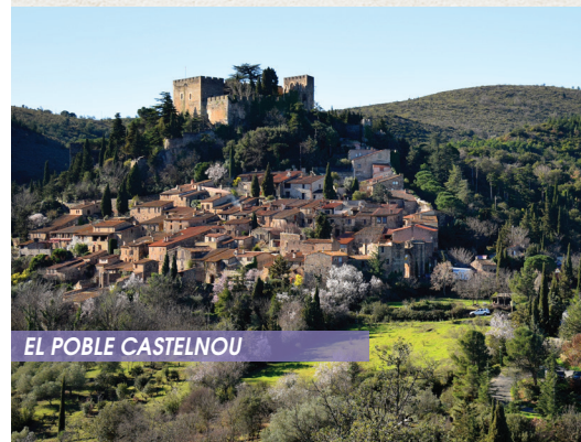
EL POBLE CASTELNOU