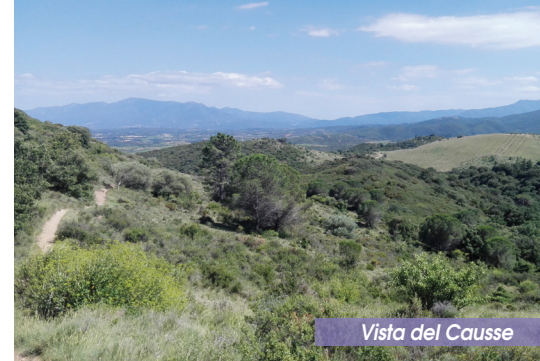
Vista del Causse

10 Seguir les indicacions cap al poble de Castellnou i aprofitar per visitar-lo, i descobrir els seus carrerons.