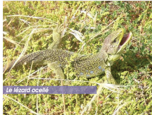
Le lézard ocellé