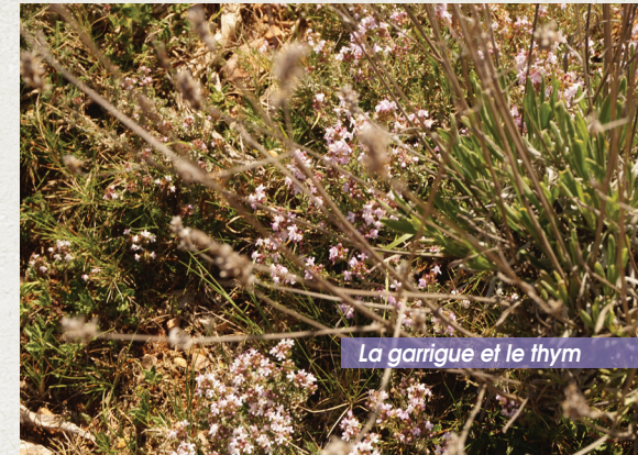
La garrigue et le thym

Au printemps, la Garrigue se couvre de fleurs aux couleurs variées, le thym est au summum de son apparence visuelle et olfactive.