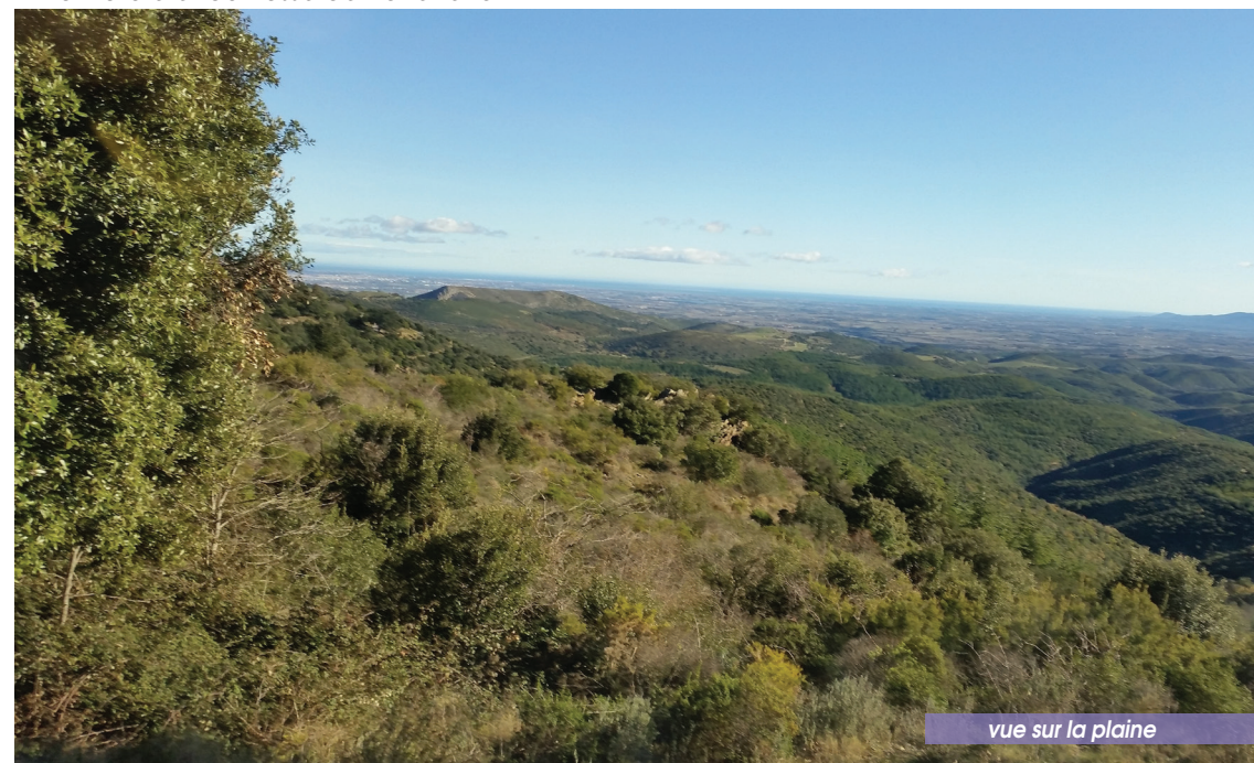
vue sur la plaine