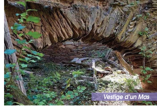
Vestige d'un Mas

10 Suivre le balisage prendre la direction qui indique « Chapelle de Fontcouverte ». Continuer jusqu'à cette chapelle, votre point d'arrivée.