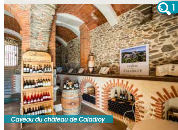
Caveau du château de Caladroy