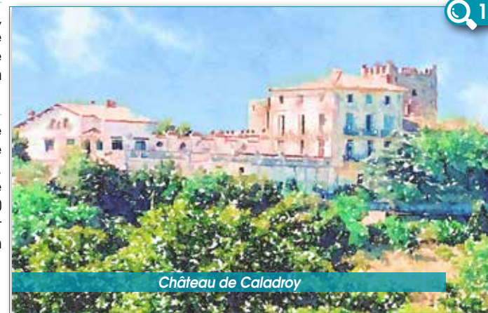
Château de Caladroy

6 Sur la piste prenez par la gauche sur moins d'une centaine de mètres, puis sur votre droite. Le chemin toujours de même direction se prolonge sur 300 m, puis s'oriente est-nord-est et rejoint l'intersection du chemin de l'aller. Vous êtes bientôt arrivé.