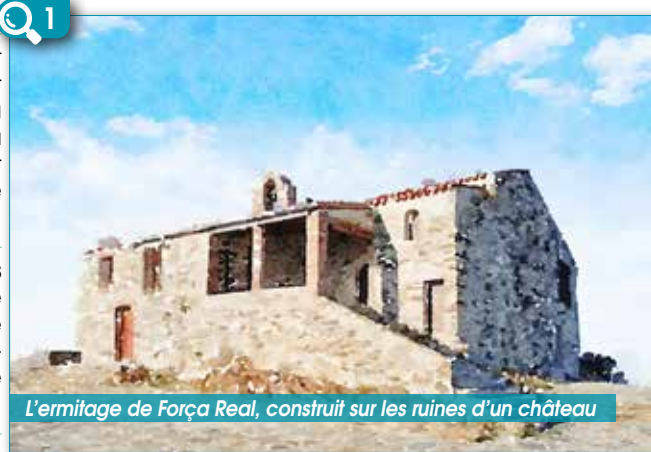
L'ermitage de Força Real, construit sur les ruines d'un château

Reprenez le chemin suivi à l'aller pour rejoindre Millas.