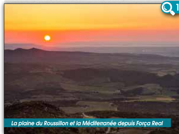
La plaine du Roussillon et la Méditerranée depuis Força Real